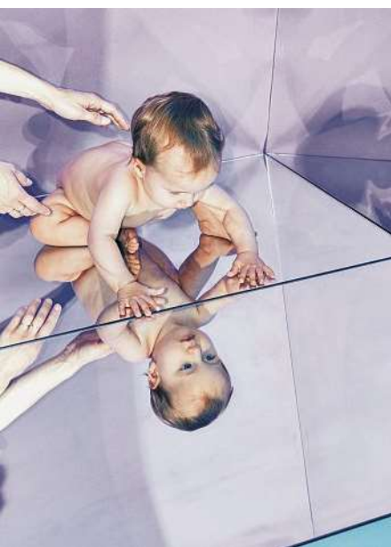
Plakatmotiv, Fotografie: Dan Cermak; Crafft/Claudia Roethlisberger. © Museum Rietberg

Die Ausstellung präsentiert erstmals die jahrtausendealte Kulturgeschichte des Spiegels umfassend. Ob im alten Ägypten, bei den Maya in Mexiko, in Japan, in Venedig oder in der Kunst und im Spielfilm von heute – Zivilisationen rund um den Globus haben Spiegel hergestellt. Die Ausstellung beleuchtet die kulturelle und gesellschaftliche Tragweite dieses reflektierenden Mediums. Es geht um Spiegel als Artefakte, aber auch um Selbsterkenntnis, um Eitelkeit und Weisheit, Schönheit, Mystik und Magie und nicht zuletzt um das Spiegelmedium unserer Zeit – das Selfie.