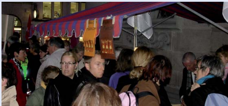
ZLV-Stand an der Demo gegen Lohnklau, 27.11.2006.

Sorge bereitete lange die Situation im Vorstand. Erfreulicherweise konnten nun zwei an unserer Arbeit interessierte junge Frauen gewonnen werden, die bereit sind, den VHFLZ zusammen mit den verbleibenden Vorstandsfrauen in nächster Zeit zu führen.